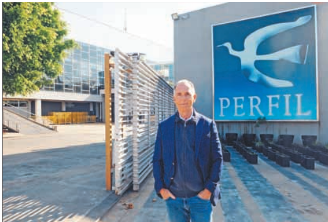
EL CAPITALISMO COMO SOLUCIÓN A LA POBREZA. “Antes del capitalismo, el 90% de la población mundial vivía en la pobreza extrema, hoy es menos del 10%”.

—Sí, creo que esto es resultado de una política muy mala de nuestro gobierno en las últimas décadas y no solo de un partido, fue culpa de Angela Merkel y, por supuesto, de Gerhard Schroeder, que está en la nómina de Putin. Fuimos advertidos por otros estados europeos. Los Estados Unidos nos advirtieron con mucha frecuencia que eso causaría muchos problemas. Pero ignoramos todas estas advertencias y ahora tenemos el problema. No se puede solucionar de un día para otro. El gobierno alemán ahora con el Partido Verde especialmente, quiere resolverlo de esta manera, con energía solar y con energía eólica. Pero tengo dudas de que sea una buena idea. Hubo un artículo en el Wall Street Journal incluso dos años antes de que comenzara este desarrollo, y el titular era “La política energética más tonta del mundo”, esto era sobre Alemania. Estoy absolutamente de acuerdo en que tenemos la política energética más tonta del mundo, porque no puedes deshacerte de la energía nuclear al mismo tiempo, y también pulir una planta de carbón, no es posible lo que estamos haciendo allí. El resultado sería que tendríamos que importar electricidad y