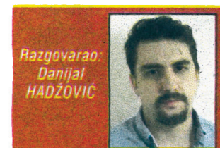
Razgovarao: Danijal HADŽOVIĆ

Država vam kontrolira dvije trećine BDP-a, imate stotine firmi u državnom vlasništvu, ogromnu administraciju, najveće privatne firme uvezane su s državom, kakav je to kapitalizam • Intelektualci su grupa koja najviše vjeruje u socijalizam