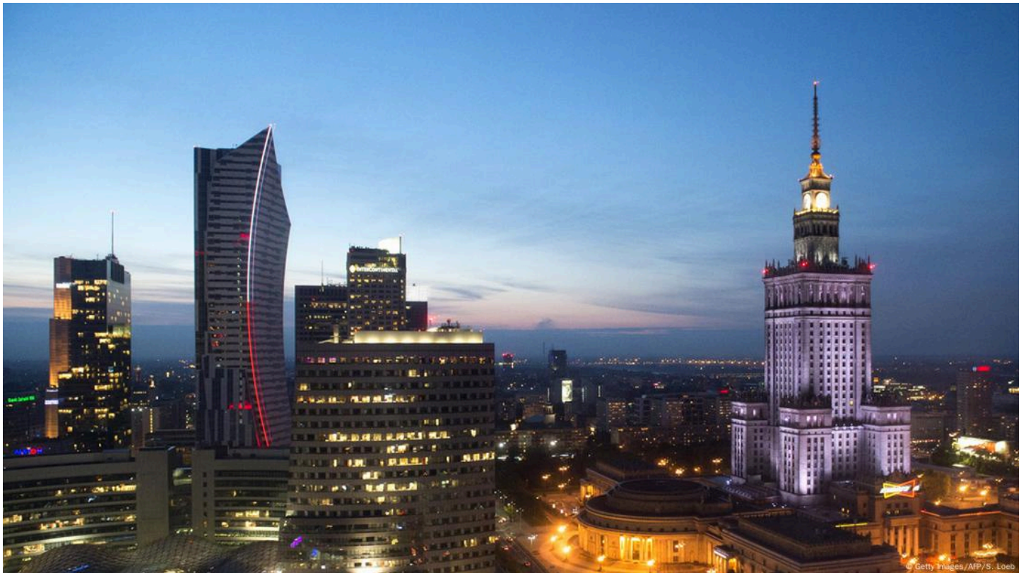
Polska gospodarka od lat rośnie jak na drożdżach

W latach 80. oba kraje znajdowały się w podobnej sytuacji: wielkie długi, wysoka inflacja, zbyt wiele państwa. W podobnym czasie, pod koniec lat 80., oba rozpoczęły reformy rynkowe. Index of Economic Freedom pokazuje, że niemal żaden kraj na świecie nie zyskał w ostatnich trzech dekadach tak wiele na wolności gospodarczej, jak Polska i Wietnam.