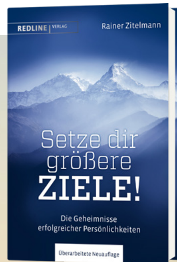
Bild: Thomas Schweigert, Depositphotos/Kotenko, Cover: Redline Verlag

Das Kapitel ist ein Auszug aus dem inzwischen in elf Sprachen erschienenen Buch „Setze dir größere Ziele“ von Rainer Zitelmann 320 Seiten Erschienen: November 2019 Redline Verlag ISBN 978-3-86881-780-5