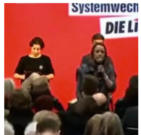
Erschießen Auf einer Linken-Konferenz plädiert eine Teilnehmerin für die Kugel

Gefragt, welche Eigenschaften man besonders häufig bei reichen Men- ▶