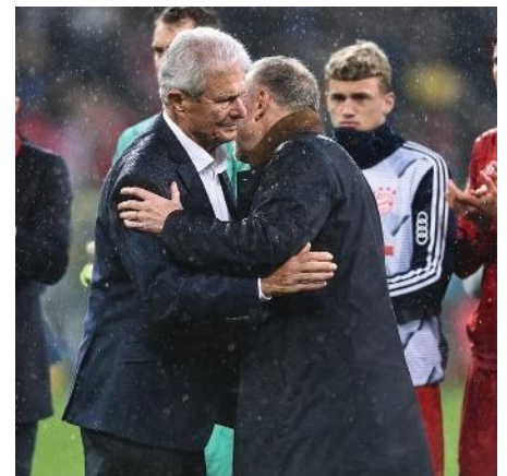
Im Fadenkreuz Fußballfans schmähen Dietmar Hopp mit Bannern im Stadion